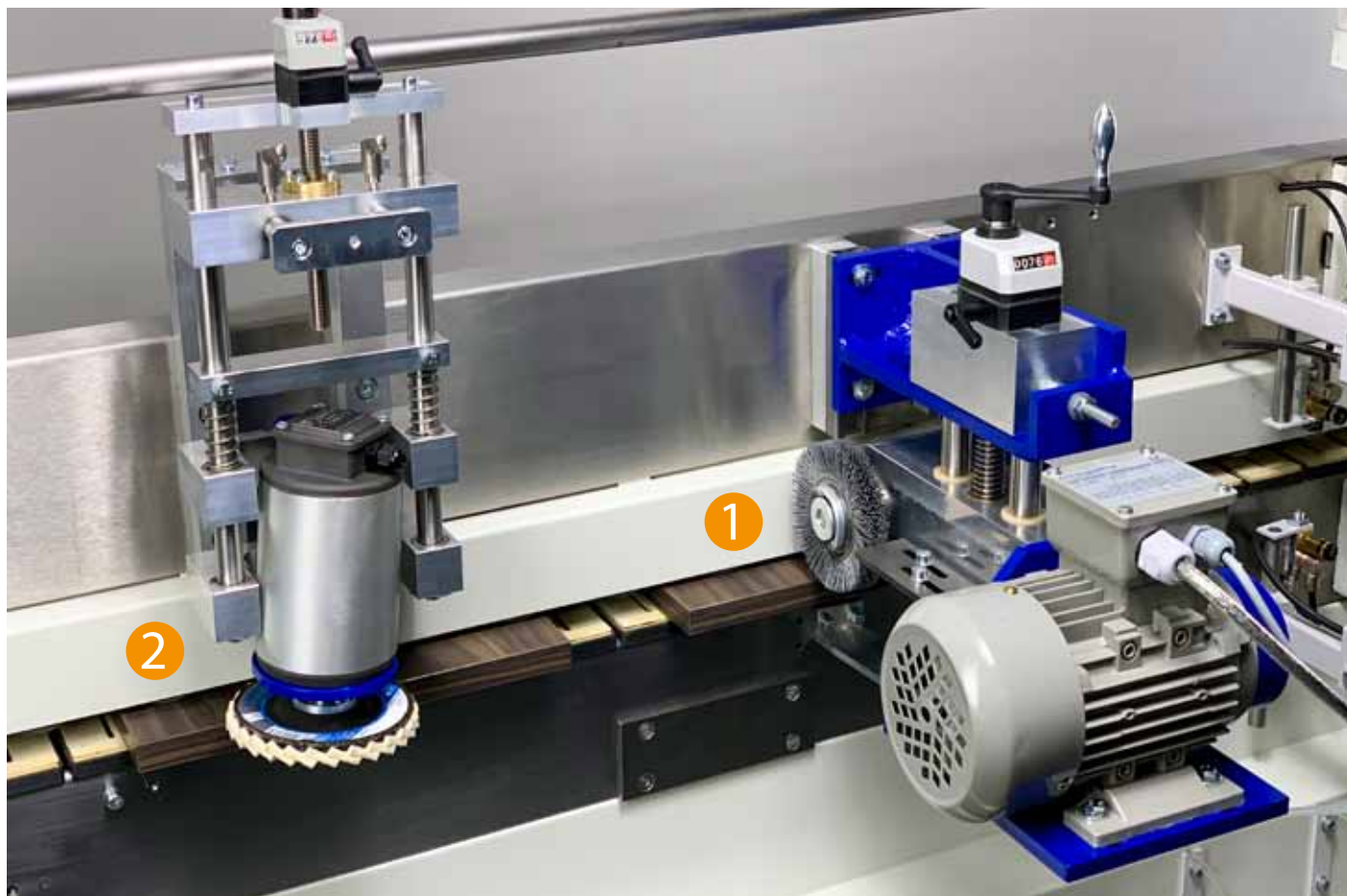
(1) Aggregato spazzola strutturale (2) Aggregato spazzola orizzontale